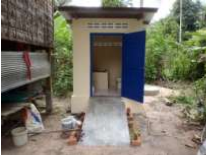
invalide toilet voor Signoon, ze heeft een dwarsleesie

De vele gedoneerde spullen als kleren etc. uitgedeeld vanuit de container.