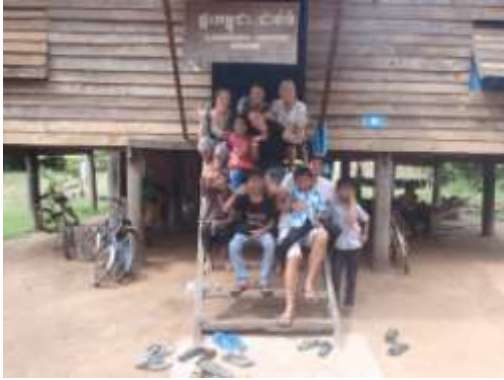
onze kids met vrijwilligers