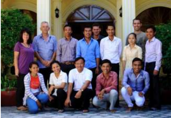
de hele organisatie