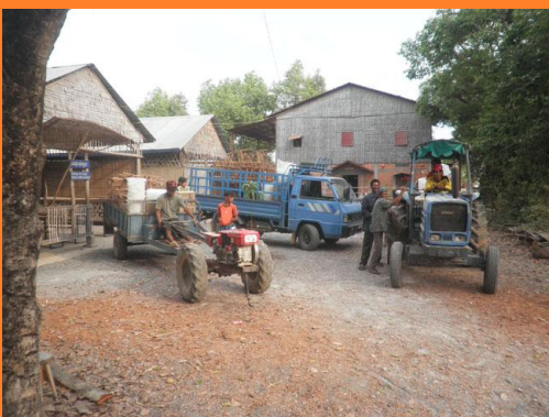
met alle mogelijke transport op weg!