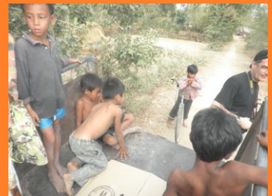
De kids helpen ons wel :-)