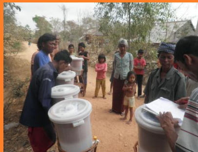
Uitdelen water filters.