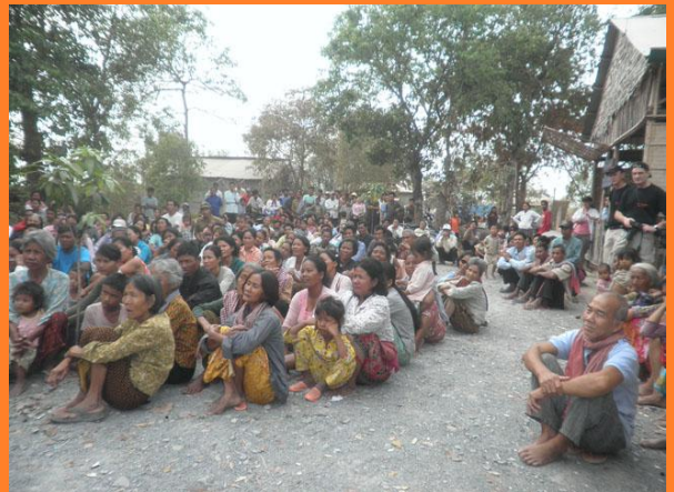
Honderden dorpsbewoners komen luisteren naar de uitleg van gebruik van de water filters door IDE