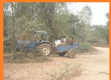
Over de stoffige wegen met de traktor.

De gekregen lijst van dorpsbewoners die in aanmerking komen voor een water filter van de hoofmannen hebben we snel zelf aangepast want hun lijst was toch teveel op hun vriendjes gebaseerd tja zo gaat dat. Leuk dagen maar ook vermoeiende dagen om alles georganiseerd te krijgen maar zeer zeker erg voldaan ! Ik zou het zo weer willen doen.