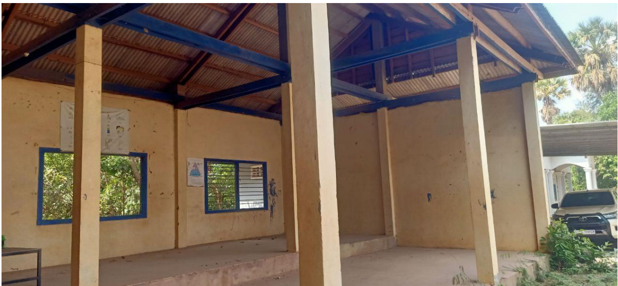
De ruimte voor moeder-en-kind-zorg

We kregen het verzoek om het leslokaal, dat jaren geleden naast de Health Care neergezet was voor Engelse lessen, te mogen gebruiken speciaal voor de moeder en kind zorg. Het medische team gaat aan de slag om deze ruimte geschikt te maken voor gebruik.