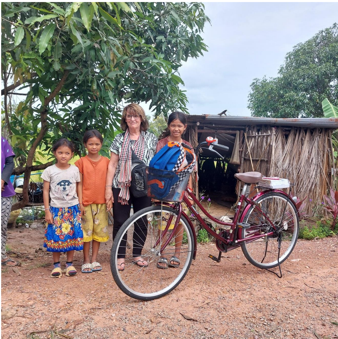
Een nieuwe fiets, nu kunnen ze samen naar school fietsen en niet meer om de beurt een dag

https://www.cambodia-dutch.org/projecten/better-life-education-farm/