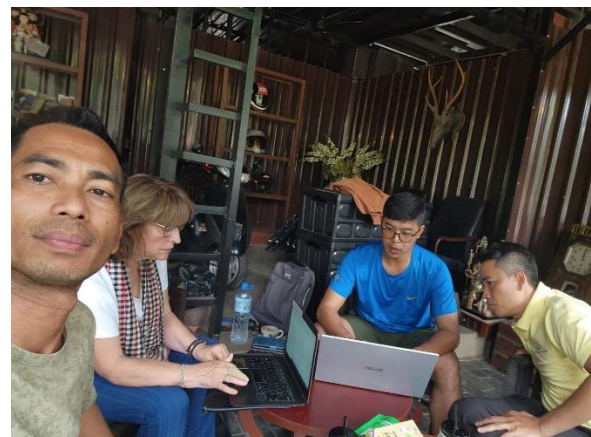
het team aan de slag voor de toeristische tour

De bezoekers brachten behalve hun warme belangstelling ook nog fietsen, schoolspullen en schooluniformen mee.