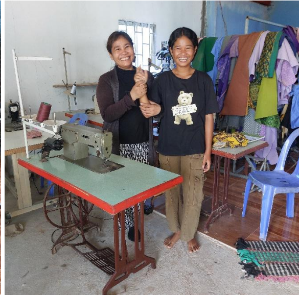
deze leerling krijgt een naaimachine voor thuis